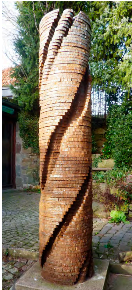
Beim Ausschneiden entsteht die innere Form des Engels. Diese Engel-Platte mit der Aufschrift „Jena 2017“ wird Teil einer Säule, die 2018 in Jerusalem aufgestellt wird.