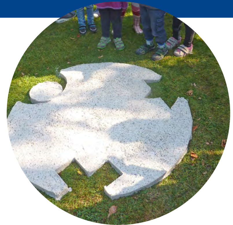
Sandabdruck an einer Station

Komm! Komm! Wer du auch bist! Komm wieder! Dies ist die Tür der Hoffnung nicht der Hoffnungslosigkeit. Auch wenn du tausendmal dein Versprechen gebrochen hast. Komm! Komm wieder!